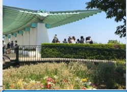
港の見える丘公園